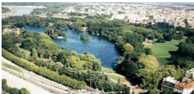
Image du parc de la tête d'or

Après cette journée agréable le car est venu nous chercher pour retourner à Chambéry. De retour à Chambéry, des camarades de classe avec leur correspondantes sont venues à la maison pour faire une partie crêpe nous étions tous ensemble c'était bien sympa, vers 9h00 ils sont tous rentrés chez eux.